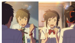
'Your name' de Makoto Shinkai clausura el ciclo 'Japón se Anima'... Canariasdiario.com