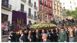
Numeroso público en la procesión del Corpus Christi conqu...