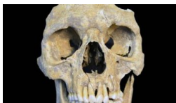
Reconstrucción pionera del genoma de virus de la hepatitis B Ultimas noticias