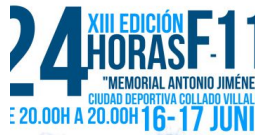
El At. Villalba organiza la XIII Edición de 24 Horas de Fútbol 11,... El Faro del Guadarrama