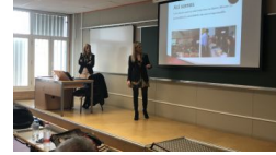
El Consejo Social de la Universidad de Almería refuerza los... noticiasdealmeria.com