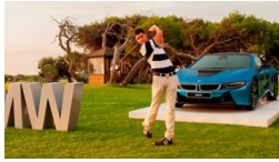
La gran final nacional llega a El Saler elperiodigolf.es