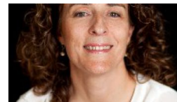
La transformación digital y el trabajo inteligente, kit de su... autonomo.es