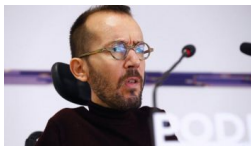
Podemos pide mejorar los permisos de paternidad y las pens... El Imparcial