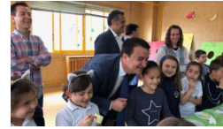
El Gobierno regional fomenta los hábitos de vida saludable entr... clm21.es