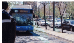
Madrid sumará 24 kilómetros de carriles bus en 2018 con actu... cronicamadrid.com