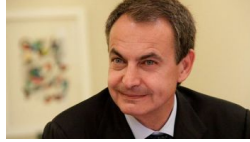
Zapatero participará en el simposio 'La Atención a la Depend... lavozdeltajo.com