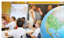
El Plan Local de Infancia y Adolescencia incluye... madriddiario.es