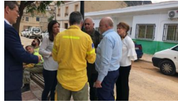
El Gobierno regional agradece la labor del dispositivo humano y... albacetediarrio.es