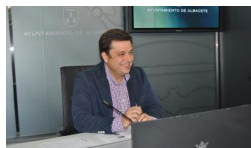
El alcalde afirma que es una "excelente noticia" que el paro h... albaceteabierto.es