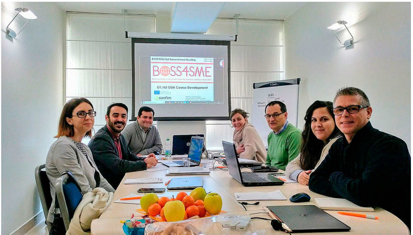
Los socios del proyecto europeo BOSS4SME en su reunión celebrada en Milán.

Los seis socios del proyecto, que representan a cuatro países (España, Grecia, Italia y Polonia) se han reunido de manera reciente en la ciudad italiana de Milán para revisar el avance y los resultados del proyecto en el último año. En este primer período, BOSS4SME ha contrastado y validado las necesidades formativas necesarias a través de un cuestionario realizado a más de 50 empresas del sector de los cuatro países del consorcio.